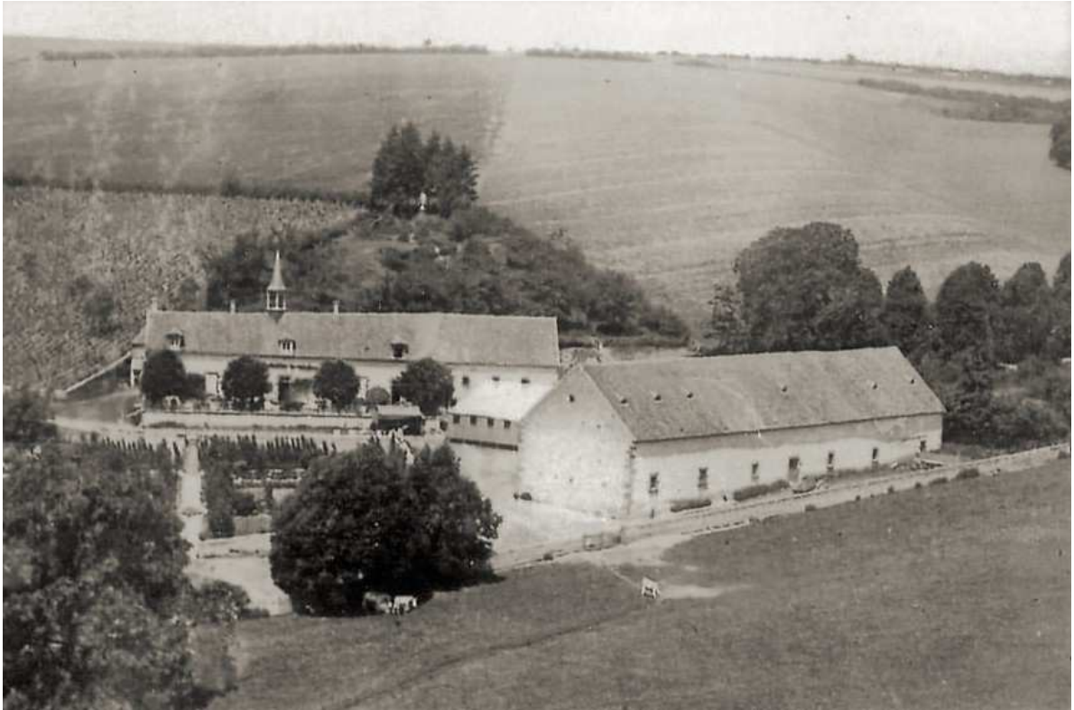
Drémont en 1908

C'est Philibert Boussard , curé de Guérigny qui suggéra à son beau frère Hippolyte Billardon d'acquérir le domaine. L'abbé, qui appréciait cette belle propriété où chaque année il venait passer quelques jours, fit ériger une statue de la Vierge dont les mains protectrices sont tournées vers la maison, puis une croix en granit fut élevée à l'opposé de la statue. Plus tard il fit placer une statue du Sacré Cœur au-dessus de la source qui fait la richesse de la propriété, puis une cloche au son argentin fut placée dans le clocheton qui dominait alors la maison. Les voyageurs, en passant, prenaient cela pour un monastère et venaient volontiers en réclamant l'hospitalité qui ne leur fut jamais refusée.